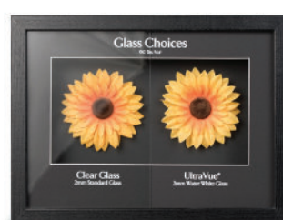
Présentoir UltraVue M99-01053INT