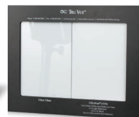
Présentoir spécifique UltraVue UV70 M99-01282