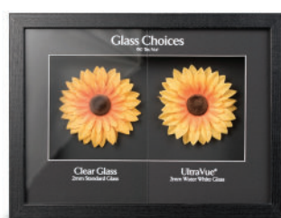
Espositore UltraVue M99-01053INT