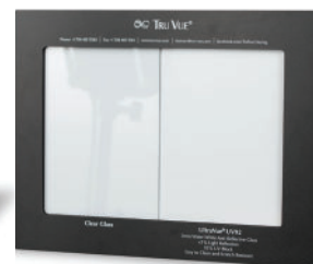
UltraVue UV70 con specifiche M99-01282