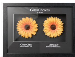
Exhibidor UltraVue M99-01053INT