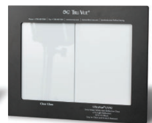
Especificador UltraVue UV70 M99-01282