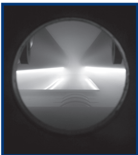
Процесс напыления магнетроном