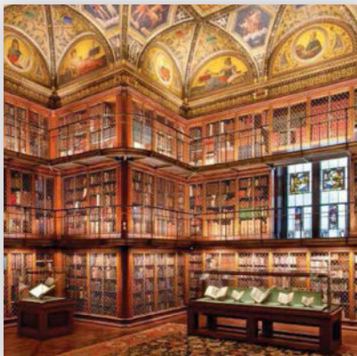
Mr. Morgan's Library (East Room). After restoration. The Morgan Library & Museum, New York, USA.