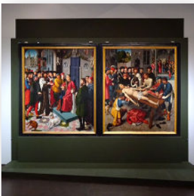
사진 제공: 그로닝게 미술관